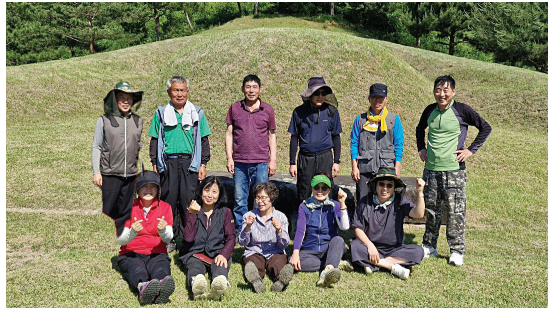
문경공 선조 묘소는 일부 청장년 회원과 가족들이 참석을 하여 제초작업, 예초작업 풀뽑기 작